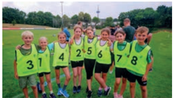
Bilder: Team U12, U10, Sprintstaffel U10: Staffelübergabe